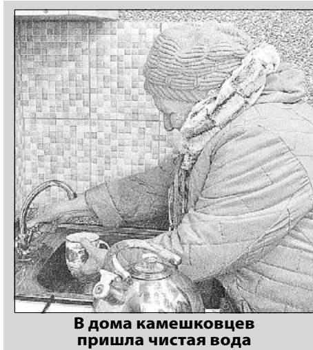
В дома камешковцев пришла чистая вода

при финансовой поддержке федерального и областного бюджетов. И в настоящее время город уже полностью подключен к водоводу, идущему от нового водозабора. В квартирах жителей Камешково появилась чистая, прозрачная вода, соответствующая всем санитарным нормам. Новые газовые котельные города также работают на чистой воде.